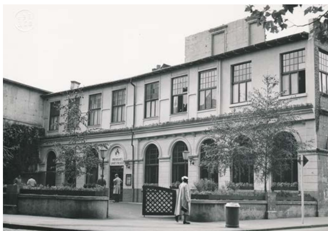
Das Rheinische Landestheater an der Drususallee Mitte der 1950er Jahre, noch vor dem 1958 eröffneten Neubau