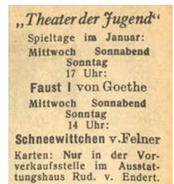
Anzeige des Theaters der Jugend, Neußer Nachrichten vom 19. Januar 1946