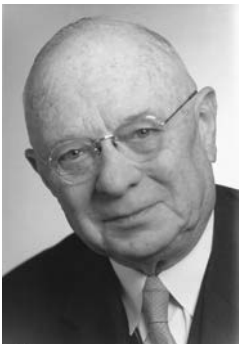
Dr. Adolf Flecken (1889–1966), CDU, seit 1947 NRW-Landtagsabgeordneter, 1950–1952 Innen- und 1952 bis 1956 Finanzminister, 1945–1961 Stadtverordneter

Allerdings machte sich in den Theatern bald eine weitere negative Folge der Währungsreform bemerkbar: Die Zuschauerzahlen gingen stark zurück. Die Läden füllten sich wieder mit lange vermissten Waren und die Menschen gaben ihr wenig neues Geld für andere Dinge als Theaterkarten aus. Müller-Stein klagte über einen Rückgang der Abonnements, den Ausfall der Gewerkschaftsvorstellungen und einen generellen Besucherrückgang. 22 Er suchte bei Stadt und Land um Unterstützung nach. Im Oktober 1948 wandte er sich auch an den Neusser Landtagsabgeordneten und späteren NRW-Minister Dr. Adolf Flecken unter anderen mit folgenden eindringlichen Worten: