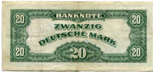
Zwanzig-DM-Schein von 1948

Allerdings machte sich in den Theatern bald eine weitere negative Folge der Währungsreform bemerkbar: Die Zuschauerzahlen gingen stark zurück. Die Läden füllten sich wieder mit lange vermissten Waren und die Menschen gaben ihr wenig neues Geld für andere Dinge als Theaterkarten aus. Müller-Stein klagte über einen Rückgang der Abonnements, den Ausfall der Gewerkschaftsvorstellungen und einen generellen Besucherrückgang. 22 Er suchte bei Stadt und Land um Unterstützung nach. Im Oktober 1948 wandte er sich auch an den Neusser Landtagsabgeordneten und späteren NRW-Minister Dr. Adolf Flecken unter anderen mit folgenden eindringlichen Worten: