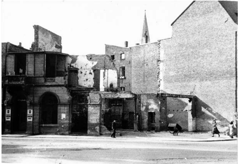
Die Reste des »Drusushof« in der unmittelbaren Nach- kriegszeit, im Hintergrund der Turm der Christuskirche

Die Gaststätte »Drusushof« an der Erfststraße war seit ihrer Entstehung im Jahr 1900 eine beliebte Neusser Freizeitstätte. Sie besaß zur Drususallee hin einen Saalanbau mit kleiner Bühne. Dort hatten Anfang der 1920er Jahre Opern- und Varieté-Aufführungen und bis 1944 zahlreiche private Feiern und Tanzveranstaltungen, aber auch Laienspiele stattgefunden. Dieser Saal war im Krieg nur zu einem Teil zerstört worden und kam den Plänen von Roland Müller-Stein nach einem eigenen Theatergebäude sehr entgegen. Er einigte sich mit dem Besitzer des »Drusushof«, Willy Herbrechter, darauf, Haus und Saal auf eigene Kosten instand zu setzen und es für eine geringe Miete als Theater anzumieten 76 .